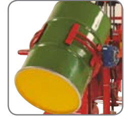
Lisävarusteina saatavissa mm. nostopuomi, tynnyrinkääntölaite, kauko-ohjaus sekä automaattinen korkeudensäätö jne.