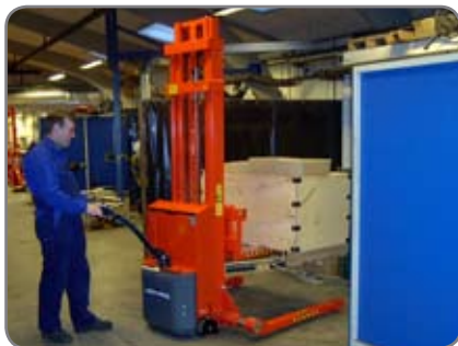
Jatkuvaan kovaan käyttöön suosittelemme SELF tai SELFS Maxia.

** levitettyjen tukijalkojen sisäleveys yli 1306 mm: Max nostokyky 800 kg. Haarukkapituus 1520 mm ei suositeltava.