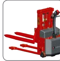
Yhdistetty käyttötuntilaskuri, akun varaustilan näyttö ja vikailmaisin.