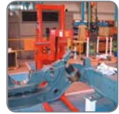
Saatavissa kallistuslaitteella ja/ tai muilla lisävarusteilla, kuten nostovarrella, tynnyrin kallistuslaitteella, kauko-ohjaimella, automaattisella korkeudensäädöllä, sisäänrakennetulla laturilla jne.