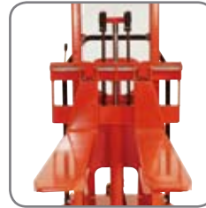
Säädettäviä haarukoita on saatavissa lisävarusteena. Useat pituudet ja rakenteet.