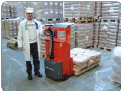
Optimaalista turvallisuutta läpinäkyvällä ja iskunkestävällä turvalasilla. Alennettu ajonopeus kun haarukakorkeus yli 500 mm.