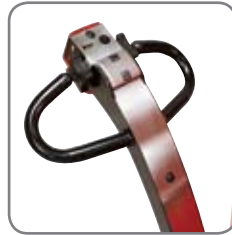
Voidaan käyttää kahva pystyasennossa. Kaikki ohjuspainikkeet on sijoitettu käyttökahvaan.

Vankka rakenne takaa pitkän käyttöiän ja alaiset ylläpitokustannukset.